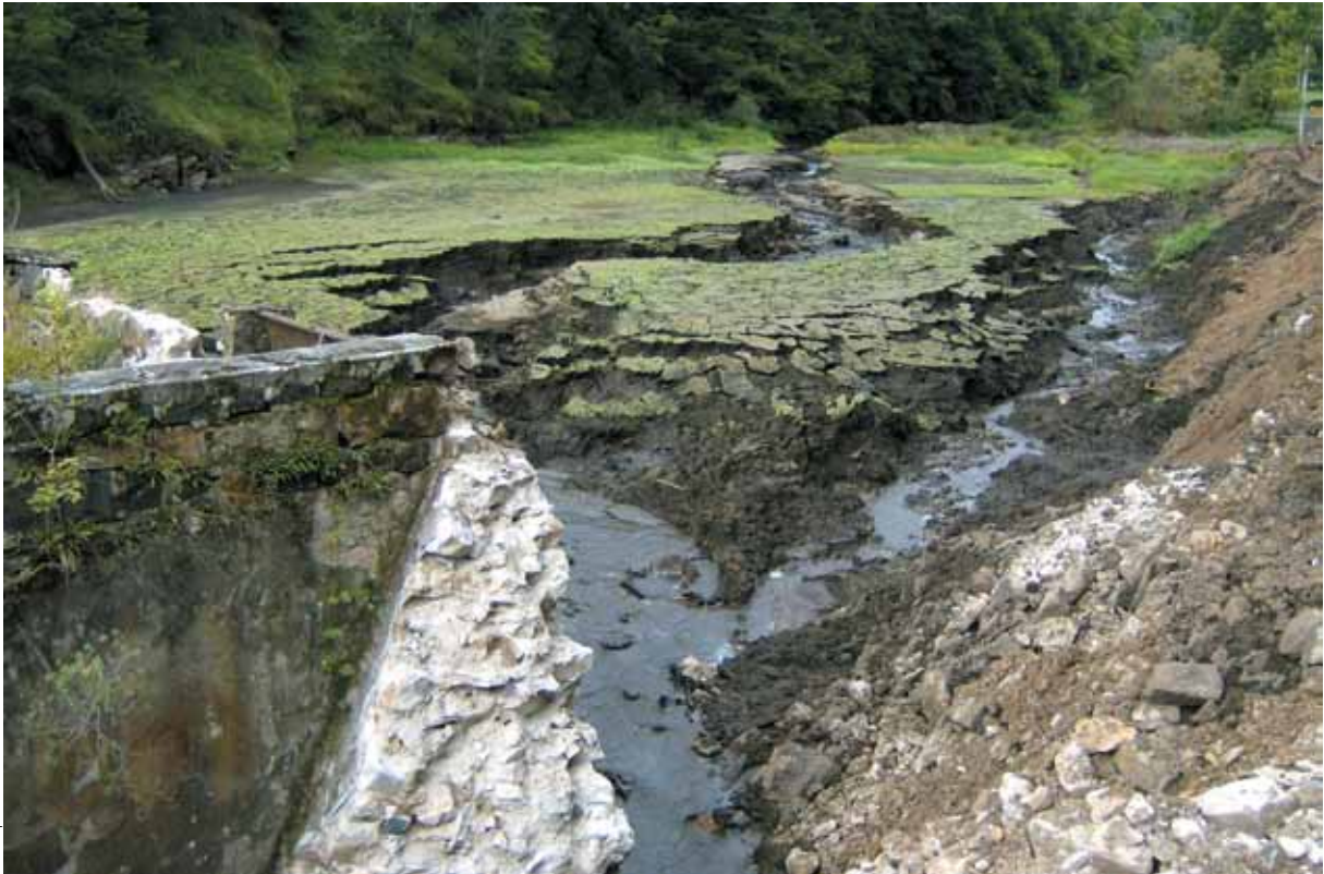
La Beaume reconstituant son lit dans les vases de l'ancien plan d'eau, en juillet 2007.

Un an après la fin des travaux, temps nécessaire au ressuyage des terrains de fond de retenue et des sédiments extraits, la zone de stockage des sédiments estensemencée avec des espèces typiques de ces milieux, permettant de reprendre l'exploitation agricole.