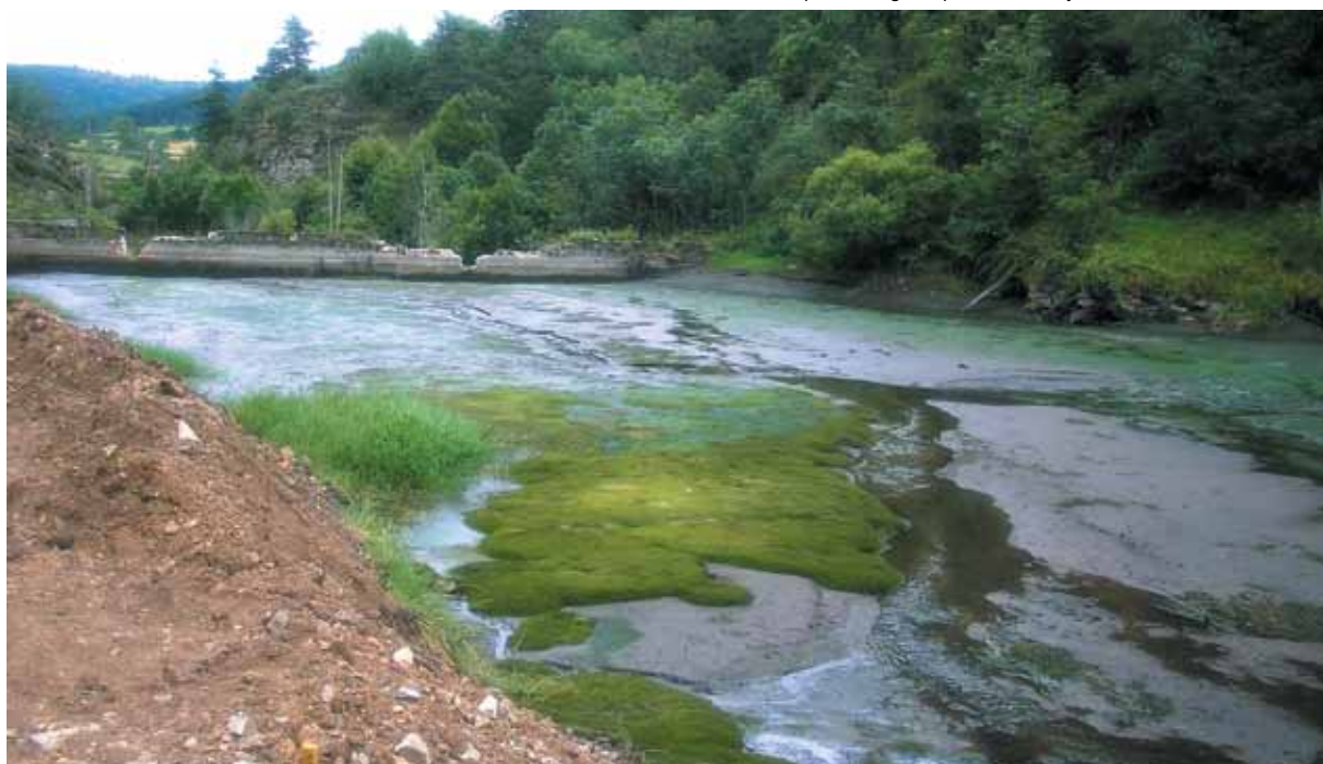
Stéphane Nicolas - FDPPIVA 43