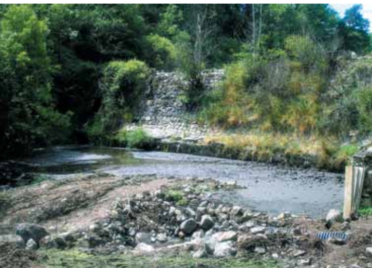
Stéphane Nicolas - FDPPIVA 43