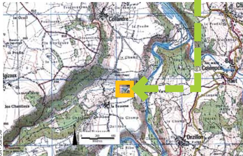
IGN - Scan250