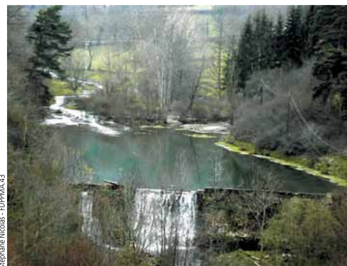
Le barrage de Fatou et sa retenue, en avril 2004.