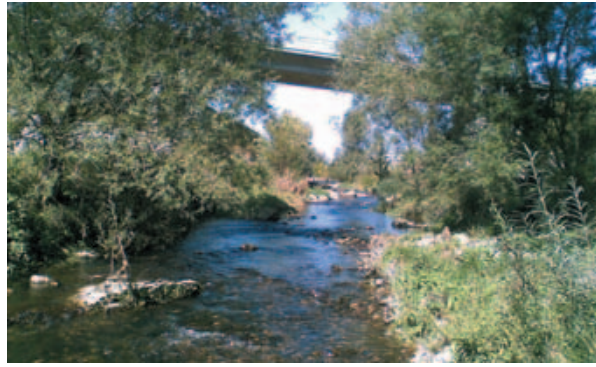
Le Lange un an après la fin des travaux, en 2009 : diversification des habitats et des écoulements.