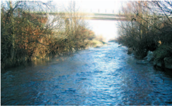
Le Lange avant travaux, en novembre 2006 : lit recalibré, faciès et habitat peu diversifiés.