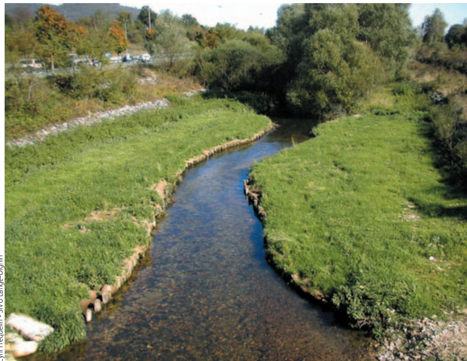
Cyril Fréquelin - SVU Lange-Oignin

En haut : le Lange avant travaux, en novembre 2006. Le lit est recalibré, les faciès et les habitats sont peu diversifiés.