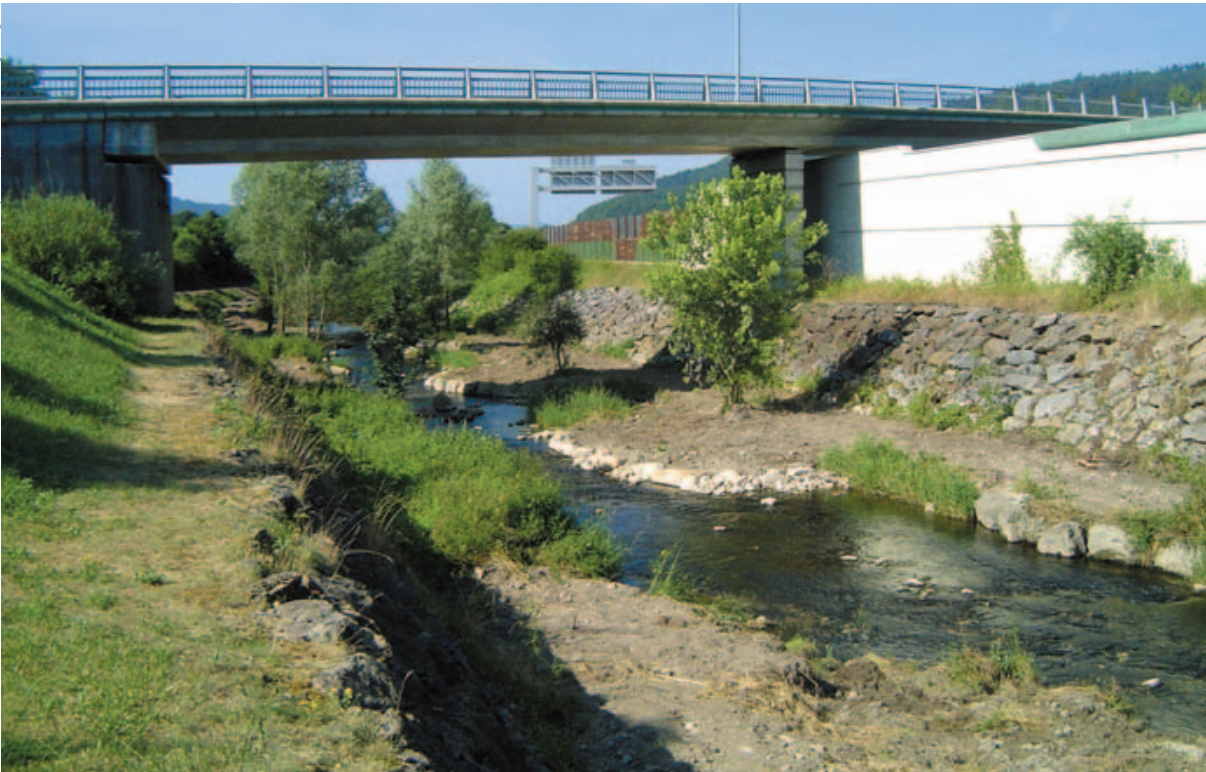
Le Lange en juin 2008, après la recréation d'un chenal d'étiage sinueux.