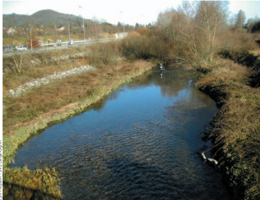
Cyril Fréquelin - SVU Lange-Oignin

D'un point de vue écologique, on peut observer, suite aux crues morphogènes survenues en avril et septembre 2008, une bonne diversification des faciès d'écoulement. Le cours d'eau semble ainsi reprendre une dynamique fluviale intéressante.