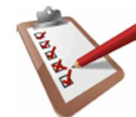
Questionnaire enquête publique