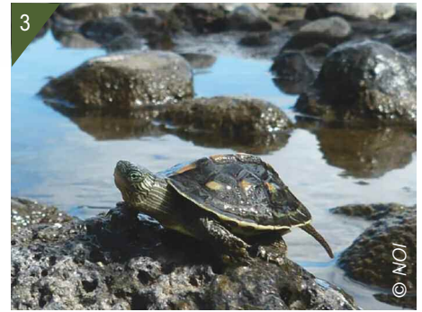
3 - Émyde de Chine observée sur la rivière des Galets.