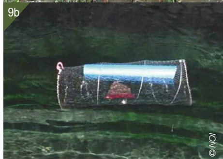
8 - Équipe de prospection sur le terrain. 9a - Piège à tunnel. 9b - Nasse à crevette.