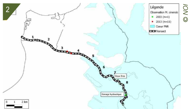
1 - Localisation de la zone d'étude.