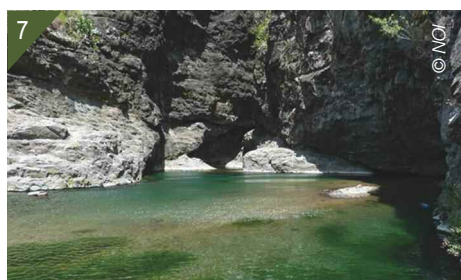
Quelques milieux prospectés favorables à M. sinensis . 4 - Lit de la rivière à herbiers aquatiques. 5 - Fossé d'eau stagnante vaseux. 6 - Zone marécageuse. 7 - Bassin de baignade en amont du barrage hydraulique.