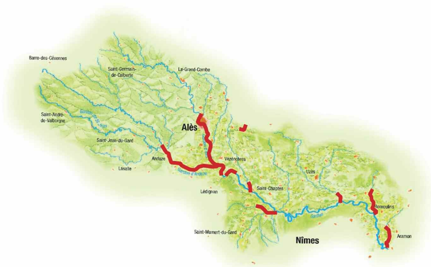
Carte de localisation des linéaires de cours d'eau surveillés annuellement.