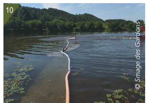
7 et 8 - Opérations d'arrachage mécanique : engin faucardeur amphibie et radeau d'évacuation des résidus (figure 7) et bateau grue et radeau (figure 8). 9 - Graines libérées des sédiments. 10 - Mise en place de filets pour éviter la dispersion des fragments de jussie lors de l'arrachage mécanique.