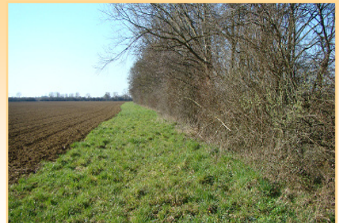
Exemple de bande enherbée doublée d'une haie arborée en bordure de fossé