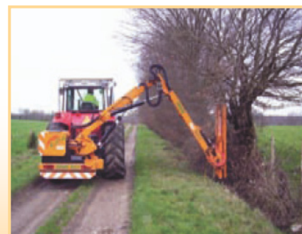
Opération de taille à l'aide d'outils réalisant une coupe nette.

Chaque dispositif ligneux doit être entretenu différemment en fonction de ses spécificités, de ses finalités mais aussi de l'occupation du sol des parcelles voisines (culture, pâturage). Pour limiter le ruissellement et l'érosion des sols, le dispositif n'a pas besoin de dépasser un mètre de hauteur, puisque c'est la densité de tige au bas du dispositif qui est importante. A l'inverse, pour être efficace du point de vue de la dérive de pulvérisation, il doit mesurer entre 4 à 8 m. Enfin, pour limiter le lessivage du nitrate, les grands arbres au système racinaire bien développé seront privilégiés.