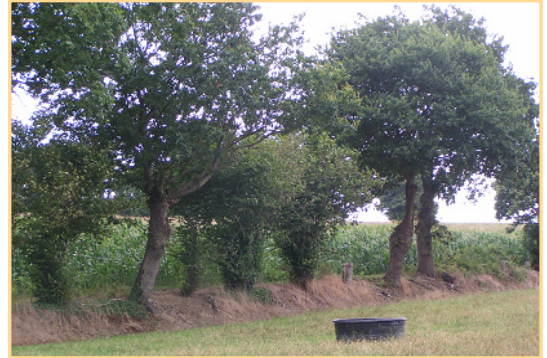
Exemple de haie arborée sur talus.

Les fascines, peuvent être incluses dans les dispositifs ligneux mais constituent une catégorie à part : il s'agit de dispositifs construits, constitués de fagots de branchages et utilisés le plus souvent pour la lutte contre l'érosion.