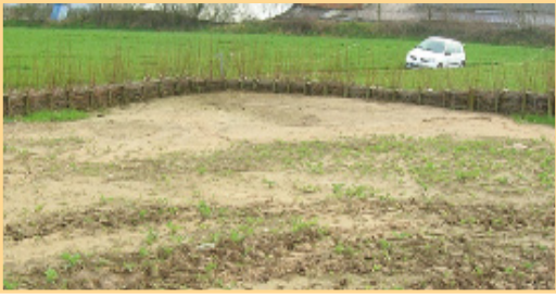
Les dispositifs ligneux : une des solutions parmi les plus efficaces pour la lutte contre l'érosion des terres agricoles

Comme tout dispositif de type zone tampon, la réflexion concernant l'implantation de dispositifs ligneux doit s'appuyer sur un diagnostic hydrologique préalable, mené à l'échelle du bassin versant. Ce diagnostic vise à caractériser les types d'écoulement (superficiel, de sub-surface ou via un réseau de drainage agricole), leur devenir depuis les parcelles jusqu'au milieu aquatique récepteur, leur dynamique et les volumes associés en fonction de la pluviométrie locale, de l'occupation du sol, des pratiques agricoles, des caractéristiques du sol et de la topographie. Il permettra de déterminer où et comment implanter au mieux les différents dispositifs selon l'objectif recherché (Fiches n°4 et 5).