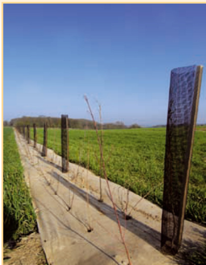
Une plantation exemplaire de jeune haie.

Les opérations de plantation peuvent intervenir dans deux cas :