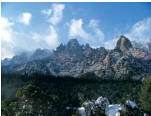
Une vue de la Réserve de Bavella, où l'ONCFS est pressenti comme futur gestionnaire.

Dans le but de répondre aux questions soulevées par le diagnostic réalisé, l'ONCFS et l'OEC ont souhaité officialiser leur collaboration par la signature d'une convention-cadre. Ainsi, les premières actions ont permis d'élaborer l'état des lieux. Cette convention pourrait aujourd'hui s'enrichir de nouvelles actions en matière d'expertise et d'assistance sur les RCFS. Il pourrait s'agir de réaliser un diagnostic approfondi de chaque réserve sur la base d'un protocole commun (analyse socio-économique, écologique, des contraintes, etc.) validé par les différents acteurs et gestionnaires. Cette analyse