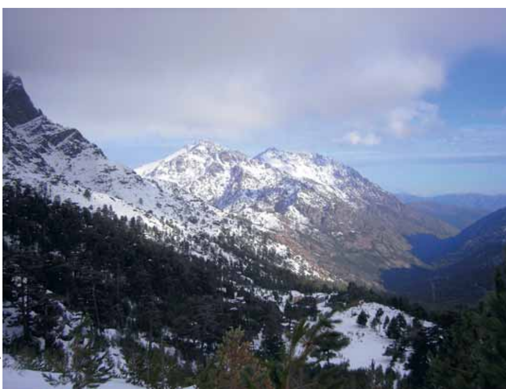
Les sommets enneigés d'Asco...

permettrait de proposer de nouvelles mesures pour une gestion cohérente des RCFS, basées sur une typologie des réserves en fonction de leur statut foncier et de leur valeur écologique (cahier des charges concernant les mesures de gestion, guide méthodologique des plans de gestion, etc.).