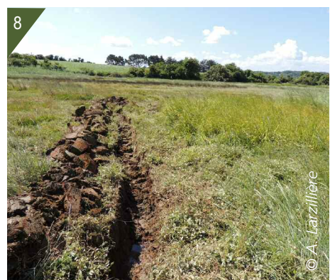
5, 6, 7 et 8 - Creusement d'une tranchée.