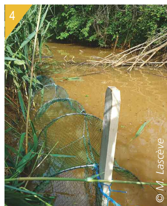
2 - Canal de ceinture des Vieux Salins. 3 et 4 - Mise en place des filets verveux.