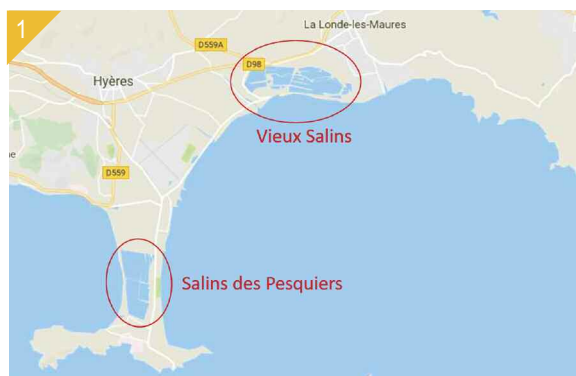
1 - Localisation du site des Vieux Salins.