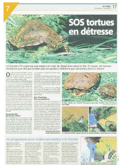
5 et 6 - Trachémydes capturées lors du piégeage. 7 - Article paru dans Var Matin le 2 juin 2013.