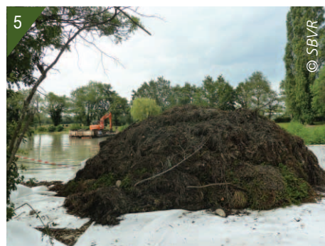
2 - Vue du plan d'eau colonisé par le myriophylle.