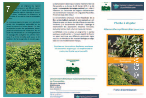
6 - Formation à la reconnaissance de l'Herbe à alligator.