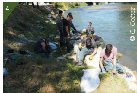
3 et 4 - Arrachages en cours par les élèves bénévoles.