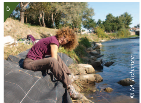
5 - Mise en place de la bâche.

■ Dans la zone bâchée, une diminution constante du recouvrement de l'espèce a été observée : passant en 2016 de 87 % de superficie recouverte avant arrachage, à 37 % en septembre 2017 (au moment du changement de bâche) puis à 16 % en 2018, et les plants étiolés restant étaient en train de mourir. À noter que la pose de la bâche a également provoqué la disparition de la quasi-totalité des parties végétatives des espèces (indigènes et exotiques) présentes, mettant le sol à nu.