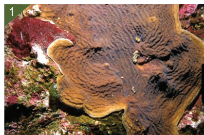
1 - Colonie d'Agarice de Graham.

Espèce sessile vivant en colonies en symbiose avec des algues ( zooxanthellae ). Alimentation à l'aide des cellules urticantes des tentacules.