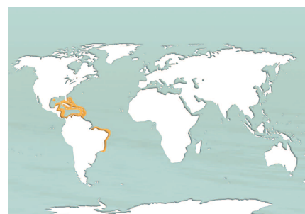
Aire de répartition de l'espèce.

Présence dans les eaux tropicales des Caraïbes, du golfe du Mexique aux côtes brésiliennes. En France, on peut la trouver dans les espaces maritimes des Antilles (Guadeloupe, Martinique, Saint-Martin et Saint-Barthélemy).