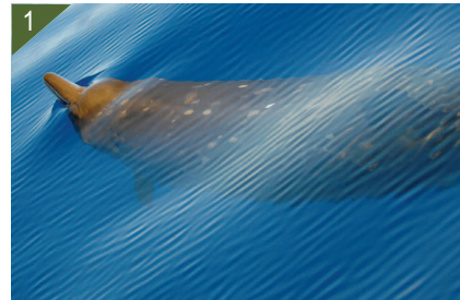
1 - Mésoplodon de Blainville.

Vie en solitaire ou en groupes de 3 à 7 individus. Des rassemblements de 12 individus maximum sont possibles.