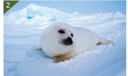
1 - Phoque du Groenland juvénile ou femelle.