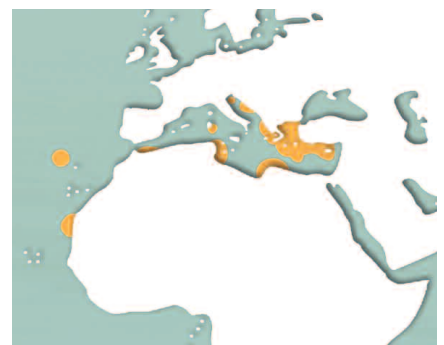
■ Aire de répartition de l'espèce.

Présence dans les eaux tempérées de la Méditerranée et près des côtes nord-ouest d'Afrique. Cette espèce n'est plus présente dans les espaces maritimes français mais, elle pourrait potentiellement regagner son ancienne aire de répartition sur la façade méditerranéenne de métropole.