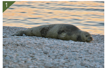
1 - Phoque moine.