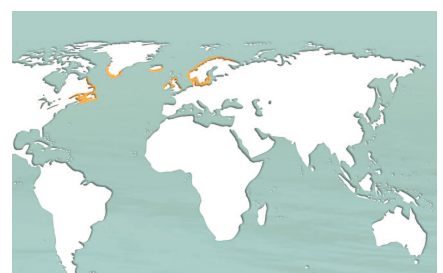
— Aire de répartition de l'espèce.

Présence dans les eaux tempérées et subarctiques de l'océan Atlantique Nord. En France, on peut le trouver dans tous les espaces maritimes de métropole et de Saint-Pierre-et-Miquelon.