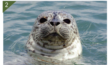
1 - Phoque veau-marin.