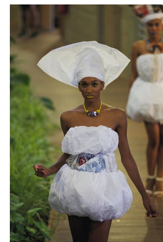
Défilé de bijoux « Survie »