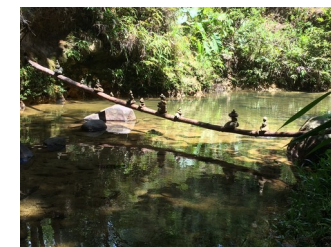
Art et nature