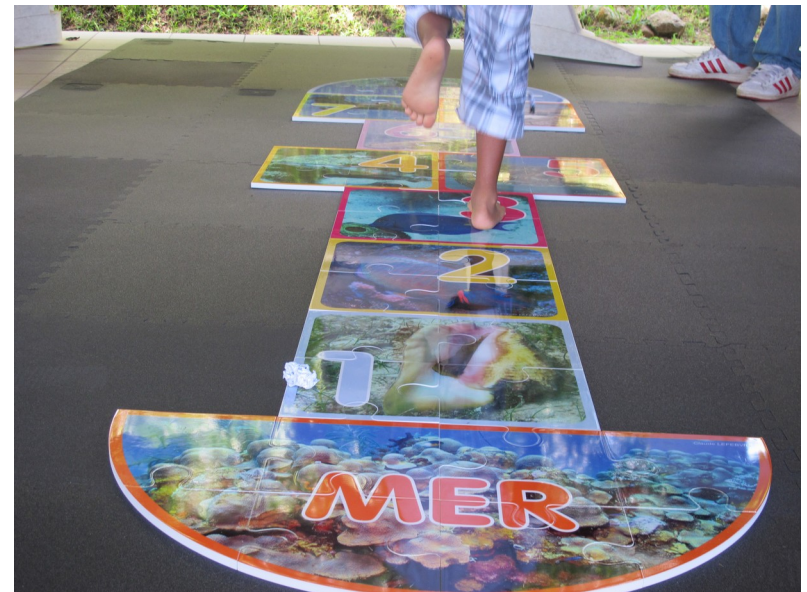
Jeu de marelle à la découverte de la faune, conçu par les agents d'accueil et d'animation