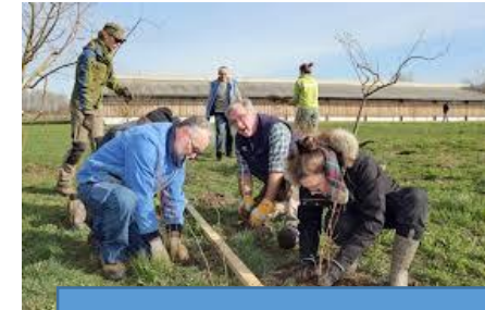
Mise en place