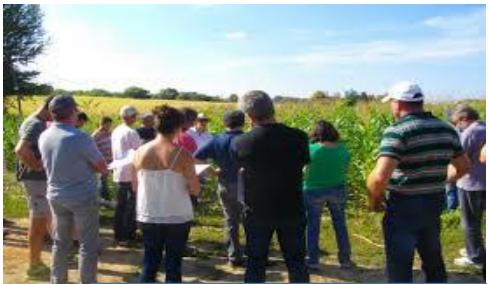
Accompagnements et formations