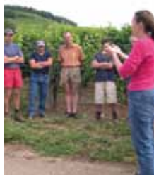
Associer tous les acteurs volontaires, informer, réunir, éduquer porte ses fruits. L'eau du captage en amont redevient bonne.

Informé sur la nocivité des produits, réunir les consommateurs, conseiller sur la gestion des effluents viticoles, apprendre les bons gestes, éduquer, animer sont au programme ; de même que sensibiliser les maires aux techniques alternatives avec des premiers plans de désherbage