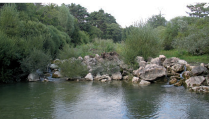
Le seuil ROE43123, avant entretien de la végétation et arasement. Août 2008