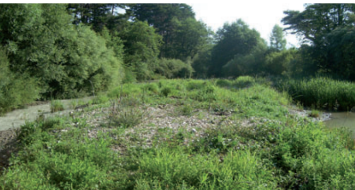
Vue de l'atterrissement formé dans la retenue avant arasement du seuil ROE43123. Août 2008