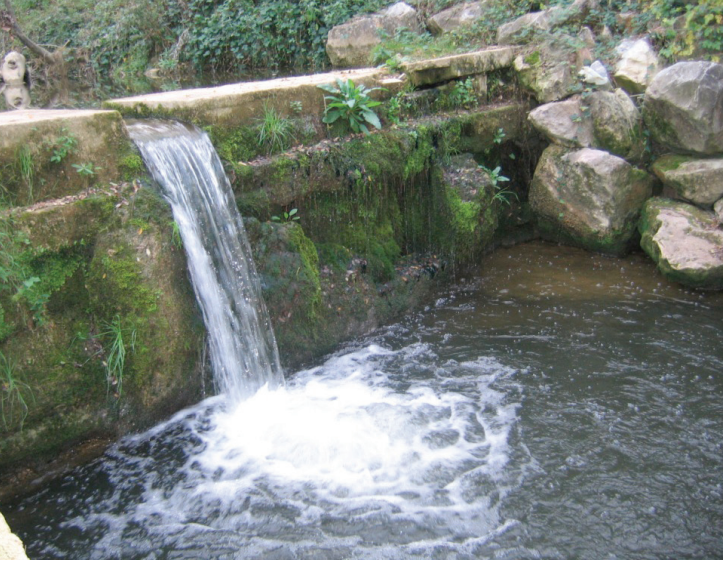
Le seuil de Guillen avant intervention. Octobre 2008