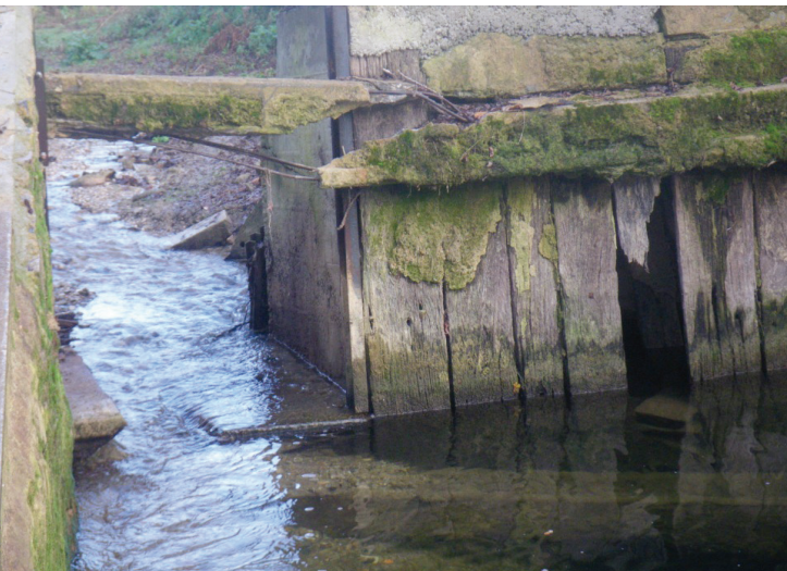
Le seuil de Guillen après réalisation de l'échancre. Hiver 2010

Des réunions de concertation ont alors lieu entre les services de l'État, l'AAPPMA et la société de pêche du Bagas – propriétaire de ces seuils. Un diagnostic préalable est réalisé en 2006-2007. Plusieurs solutions techniques sont étudiées : installation de passes à poissons, effacement partiel (arasement) ou total des seuils (dérasement). La solution d'arasement des seuils a finalement été retenue, notamment pour des raisons de coûts et de moyens techniques. En effet, cette solution permettait à la société de pêche de réaliser elle-même les travaux et également de palier une éventuelle érosion des berges en aval.