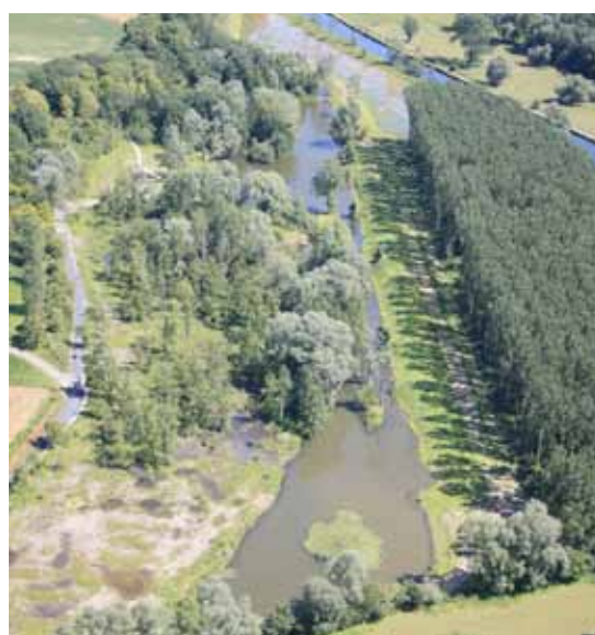
Vue aérienne des marais de Fampoux après restauration