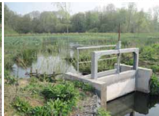
Dispositif de gestion de la frayère assurant la connexion entre cette dernière et la Scarpe canalisée. Printemps 2013

hydraulique. Au total, 1,7 ha de zone de végétation aquatique favorable à la fraie ont été restaurés.