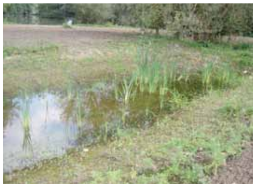
Recolonisation naturelle de la végétation suite aux travaux de création de mare au niveau des Marais de Verlaine. Printemps 2011