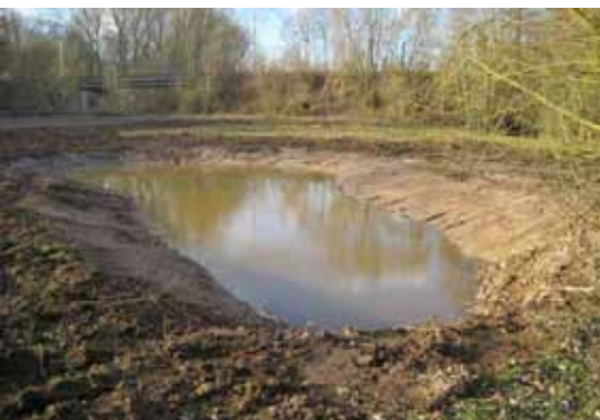
Création de la mare principale du marais Verlaine. Hiver 2010